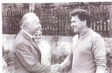
Alexander Dubček na návšteve v Lukavici