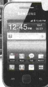
Samsung GALAXY Y